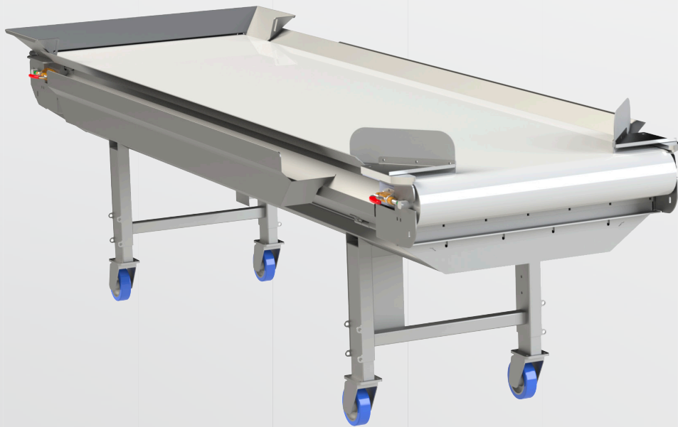
TABLE DE TRI À BANDE